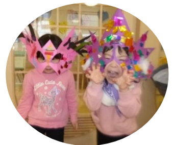
鬼の面、それぞれ工夫してカッコイイものができました!!

2月2日に節分・豆まき会を行って、鬼がちょっぴり怖い様子の子もいましたが、「鬼は外! 福は内!」とみんなで力を合わせ、やってきた鬼を退治することができました。