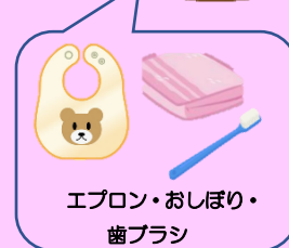
エプロン・おしぼり・ 歯ブラシ